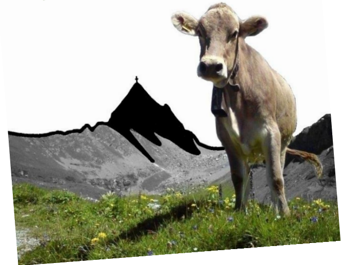
Die Karibik in den Bergen